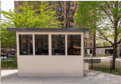
Помещение охраны в Independence