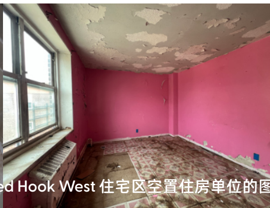
疏于维护的住房单位